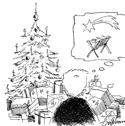
Dat was nog eens wat!!